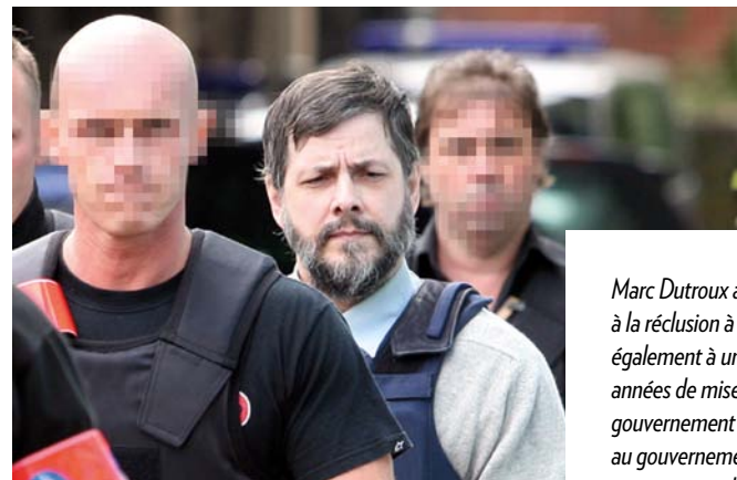
Marc Dutroux a aussi été condamné à la réclusion à perpétuité, mais également à une peine de dix années de mise à la disposition du gouvernement (peine permettant au gouvernement de le garder en prison en cas de libération conditionnelle). Dutroux a déjà demandé à pouvoir purger sa peine à l'extérieur de la prison sous la surveillance d'un bracelet électronique, ce qui lui a été refusé.

les parties civiles via l'asbl Médiante (service de médiation entre auteurs et victimes d'infraction, agréé par le service public fédéral Justice, NDLR). Celles-ci l'ont refusé, ce qui est tout à fait compréhensible.