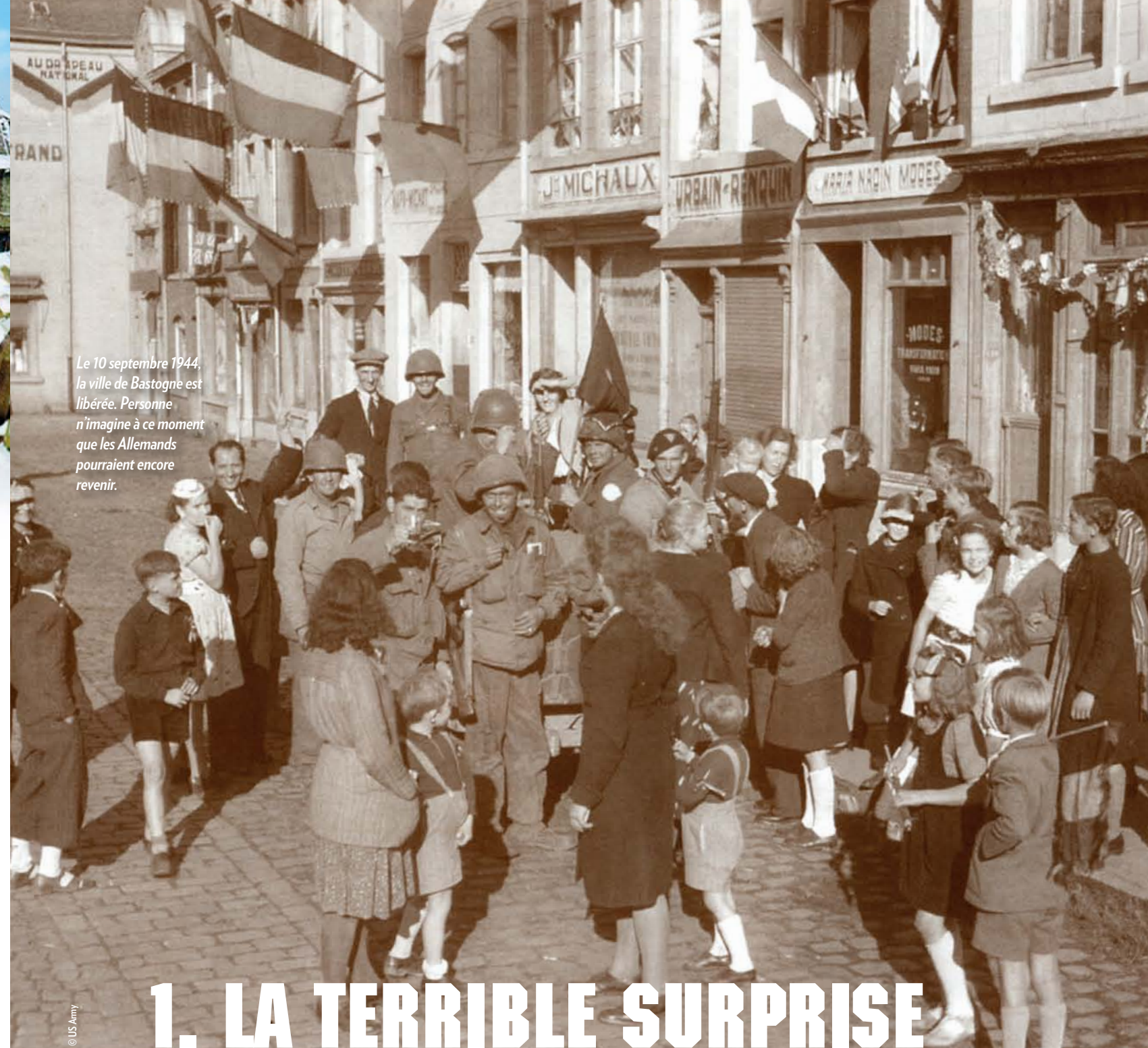
Le 10 septembre 1944, la ville de Bastogne est libérée. Personne n'imaginait à ce moment que les Allemands pourraient encore revenir.