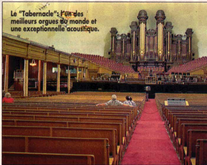
Le "Tabernacle": l'un des meilleurs orgues du monde et une exceptionnelle acoustique.